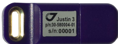
Электронный ключ p/n 30-580004-01

Воспользуйтесь всеми ее преимуществами, позволяющими систематизировать вопросы по типу продукта, сохранять вопросы, получить быстрый ответ службы технической поддержки. Войдите на сайт JAVAD GNSS, в раскрывающемся списке меню выберите пункт QUESTIONS (Вопросы) .