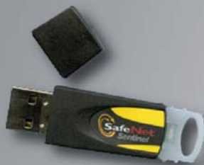
Электронный ключ Sentinel SafeNet USB р/п 30-040403-01